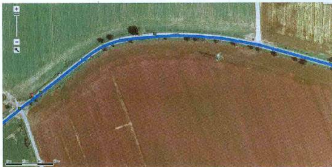
situace směrového oblouku

Rozbor dopravních nehod byl proveden pouze v uvedeném směrovém oblouku. Celý úsek silnice Ohrozim-Vícov je nebezpečný. V r. 2013 a to 8.1. v 10,50 hod. došlo k dopravní nehodě se smrtelným zraněním cca 2 km od místa této smrtelné nehody směrem na Ohrozim a to opět nárazem vozidla do stromu.