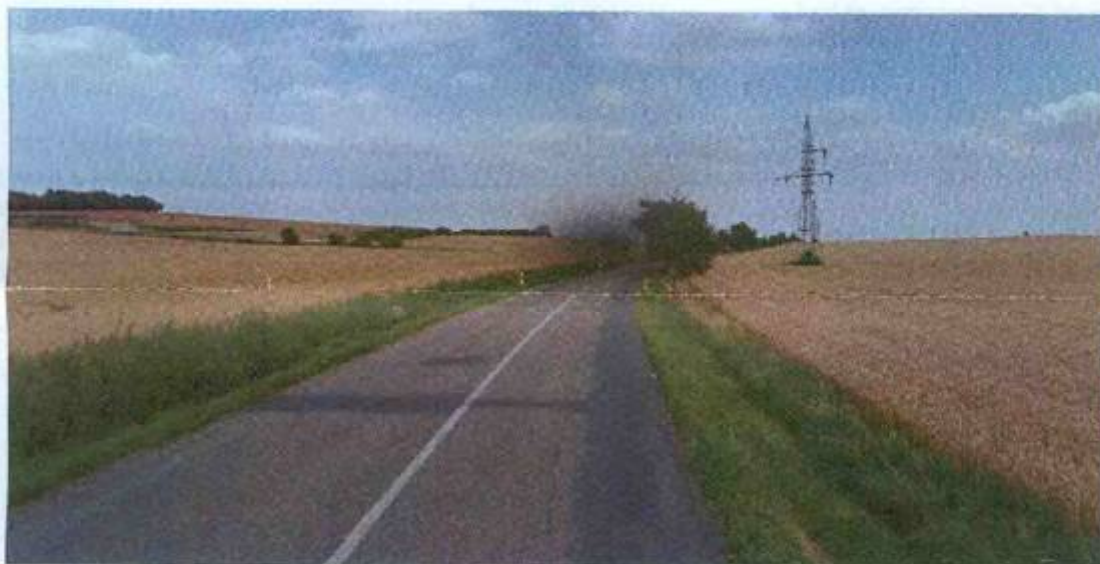
na konci směrového oblouku