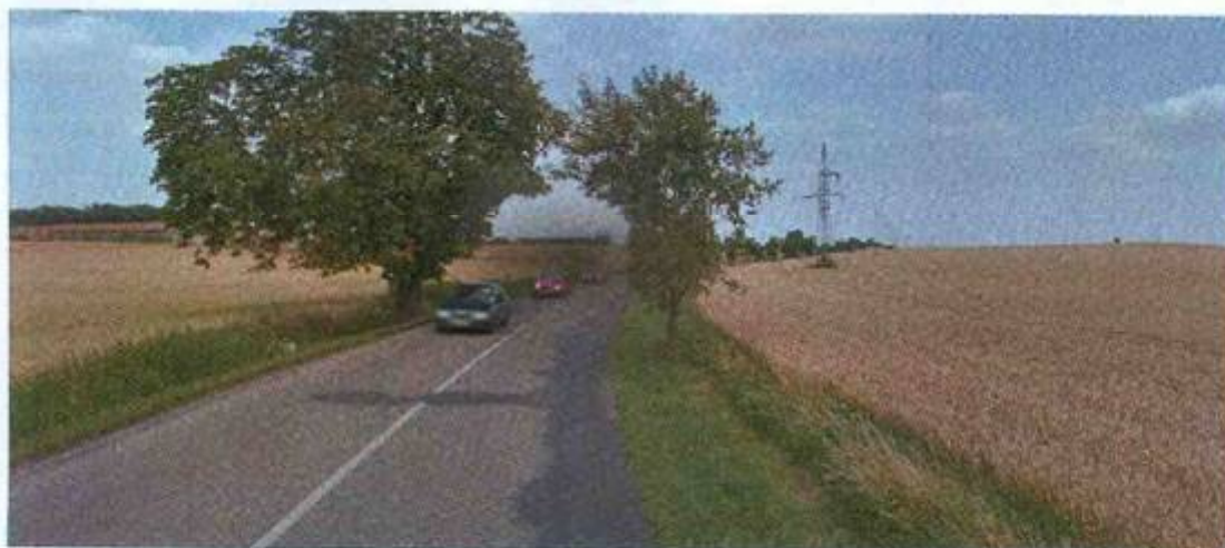
ve směrovém oblouku od Vívava