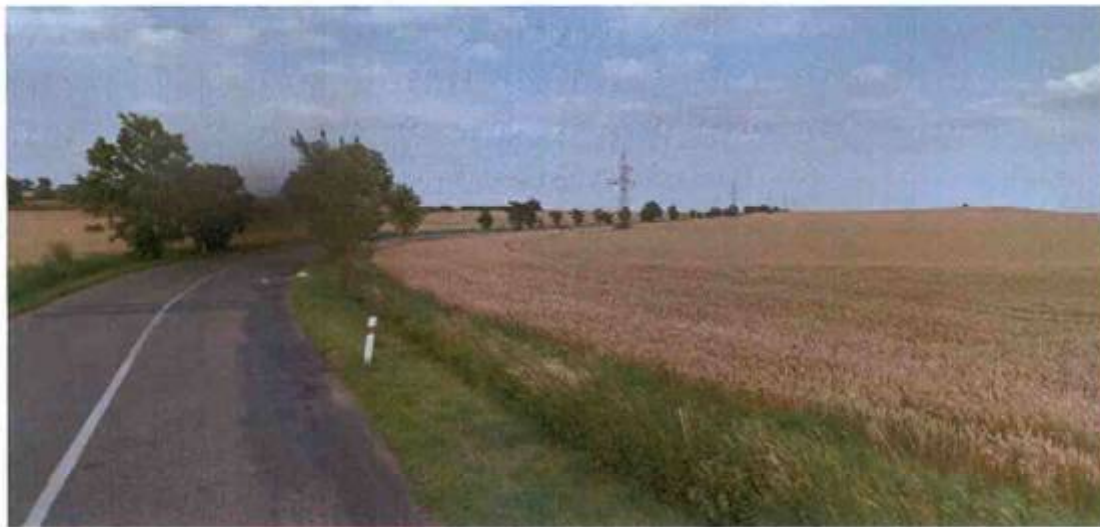
začátek směrového oblouku od Vícova