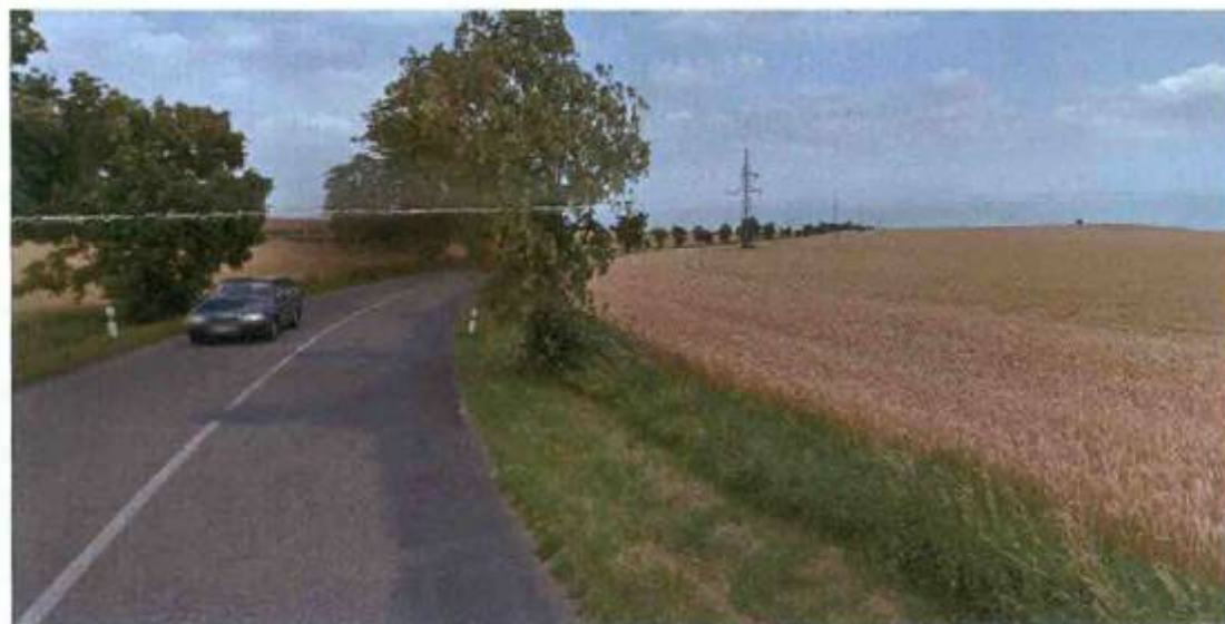
ve směrovém oblouku od Vícova