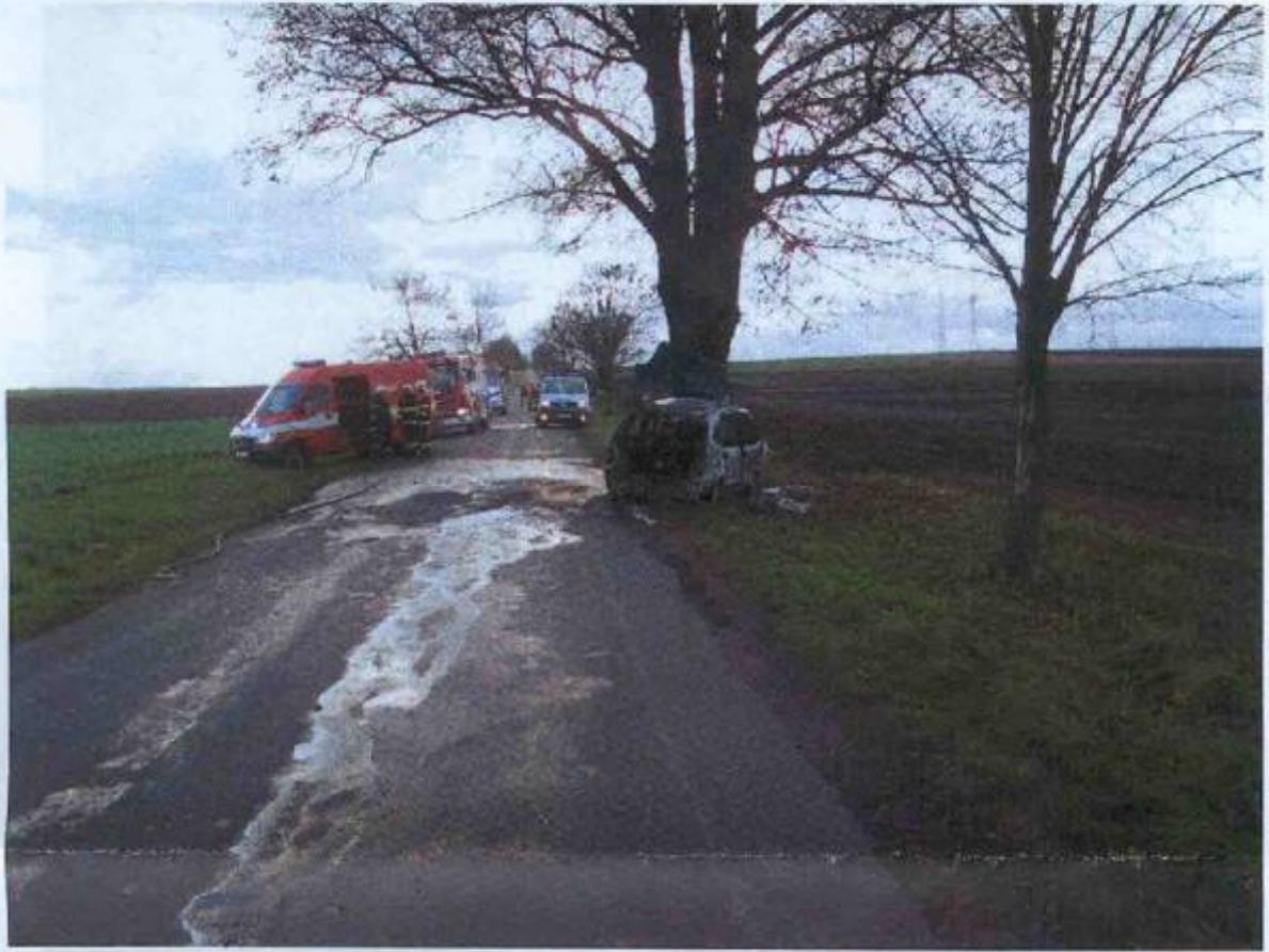
místo dopravní nehody